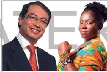
PRESIDENTE GUSTAVO PETRO VICEPRESIDENTA FRANCIA MÁRQUEZ MINA