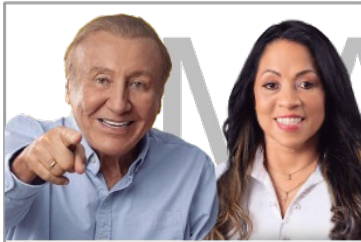
PRESIDENTE RODOLFO HERNÁNDEZ VICEPRESIDENTA MARELEN CASTILLO