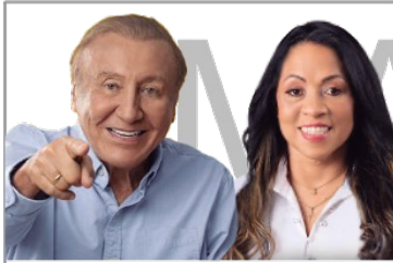
PRESIDENTE RODOLFO HERNÁNDEZ VICEPRESIDENTA MARELEN CASTILLO