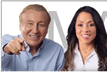
PRESIDENTE RODOLFO HERNÁNDEZ VICEPRESIDENTA MARELEN CASTILLO