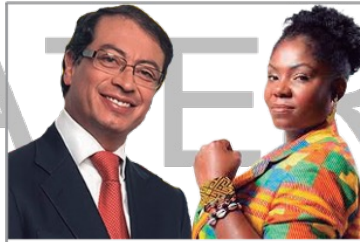
PRESIDENTE GUSTAVO PETRO VICEPRESIDENTA FRANCIA MÁRQUEZ MINA