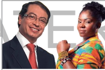
PRESIDENTE GUSTAVO PETRO VICEPRESIDENTA FRANCIA MÁRQUEZ MINA